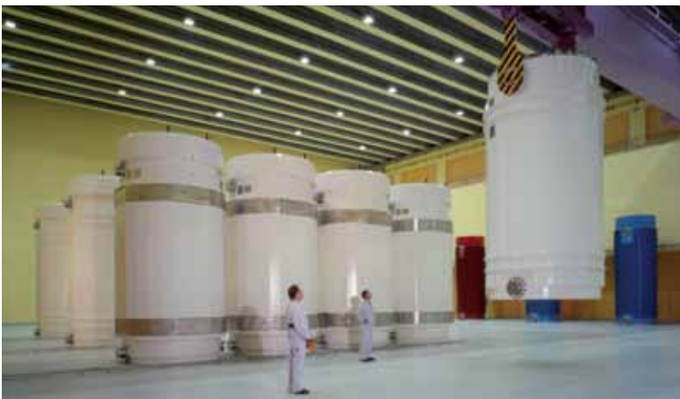
Blick in das Zwischenlager in Würenlingen (Kanton Aargau) mit den Behältern für abgebrannte Kernbrennstoffe und hochradioaktive Abfälle. Die Kosten werden von den Verursachern getragen.

Seit Beginn der nuklearen Stromerzeugung in der Schweiz vor rund 40 Jahren werden aus den Produktionserlösen laufend Rückstellungen für Entsorgung und Stilllegung gebildet. Damit wird sichergestellt, dass am Ende der Betriebszeit der Kernkraftwerke die benötigten Mittel vorhanden sind.